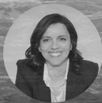
Natij Pozón Operaciones