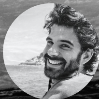
Miguel Álvarez Documentación